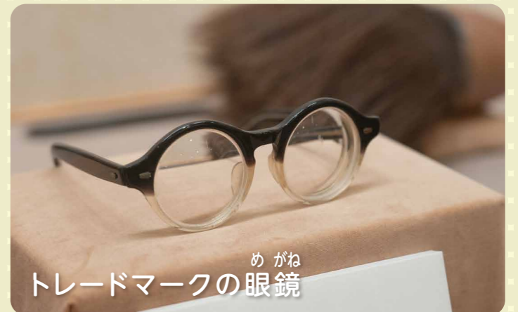
トレードマークの眼鏡