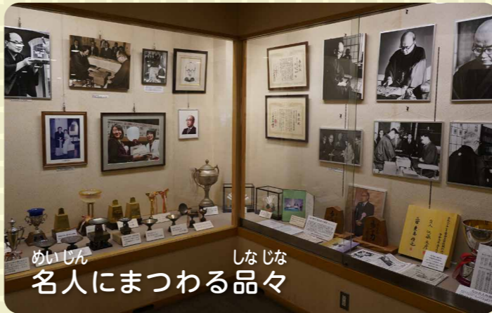
名人にまつわる品々