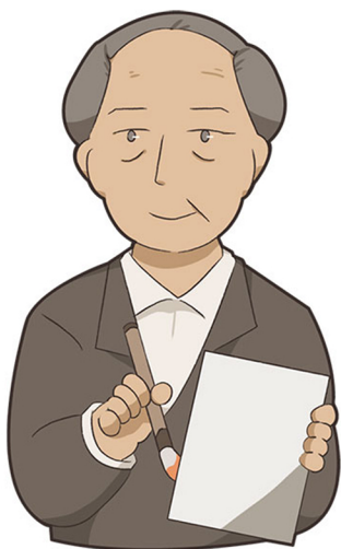
お 小 野 竹喬 の ちつきょう