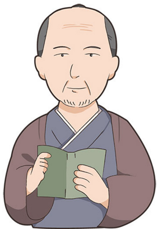
こ 小 寺 清先 でら きよさき