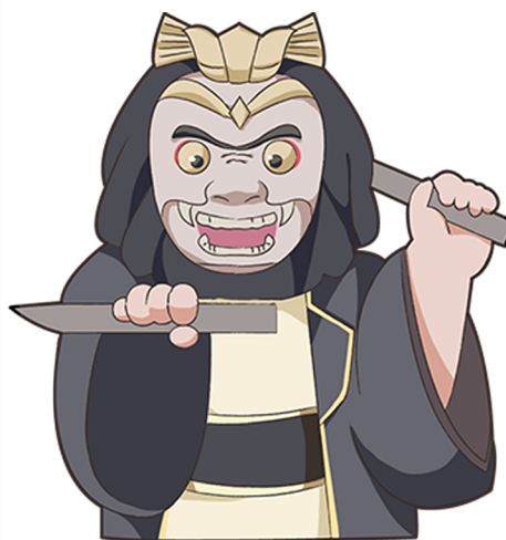
にし 西 林 國橋 ばやし こつきょう