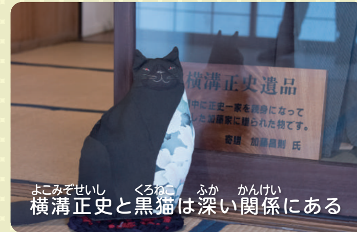
よこみぞせいし くらねこ ふか かんけい 横溝正史と黒猫は深い関係にある