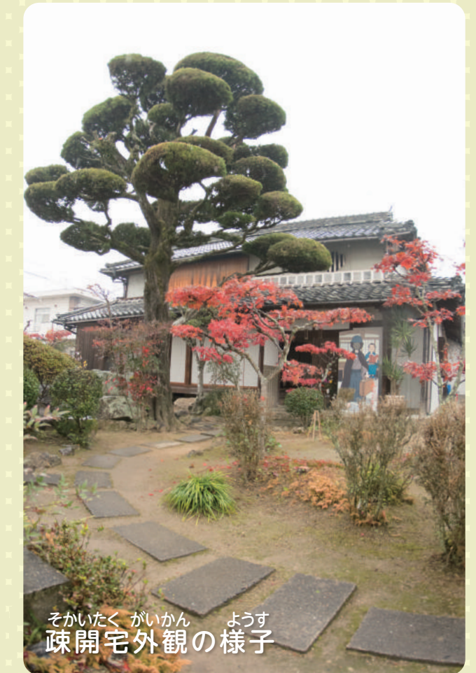
そかいたく がいかん ようす 疎開宅外観の様子