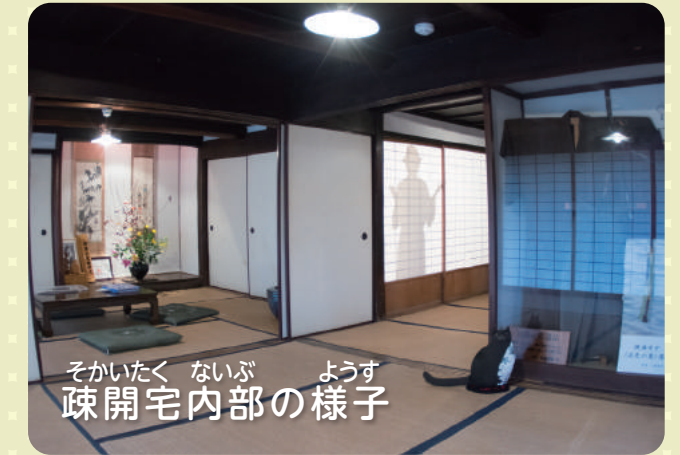
そかいたく ないぶ ようす 疎開宅内部の様子