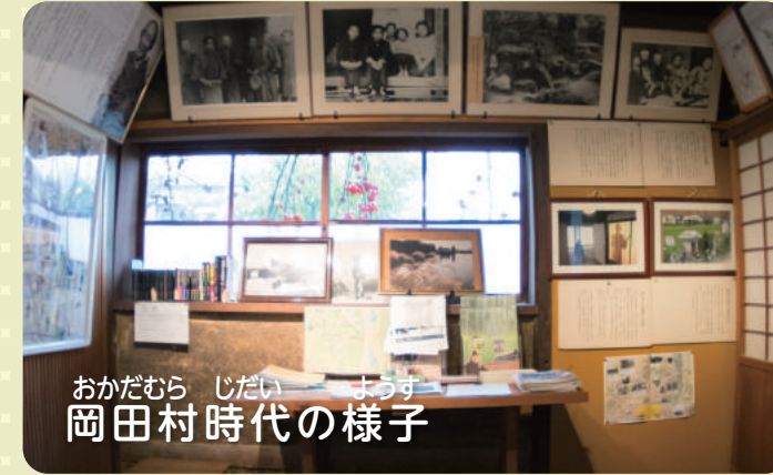
おかだむら じだい まうす 岡田村時代の様子

とうしせつ よこみぞせいし じんぶつ いま ちいき ぜんこく かたがた あい りゆう くれ めいさく かずかず きんだいち 当施設が横溝正史という人物が今も地域や全国の方々に愛されている理由や、彼の名作の数々と金田一 こうすけ みりよく きょうみ も おも 耕助というキャラクターの魅力に興味を持ってもらえるささやかなきっかけになれば、と思っています。 きがる らいかんくだ やまざき ぜひお気軽にご来館下さい。(山崎 080-1902-6512)