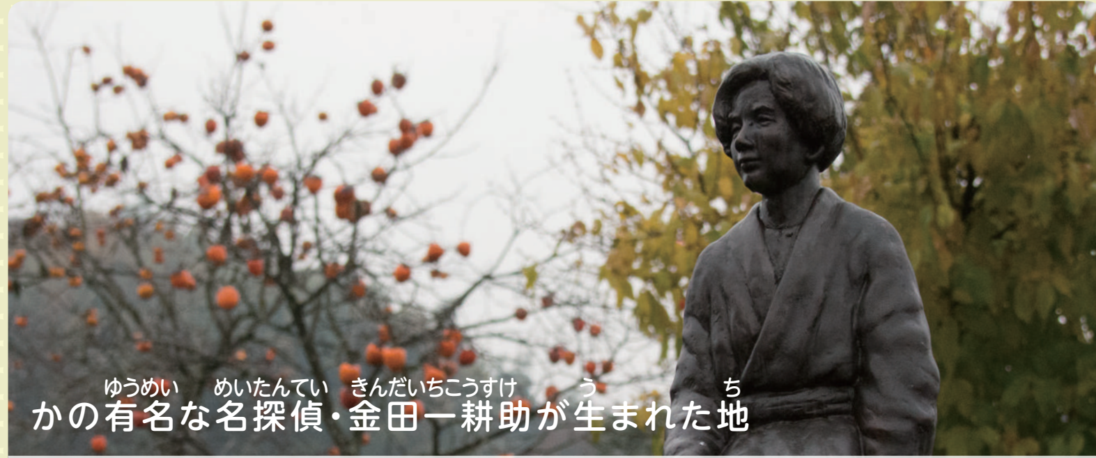
ゆうめい めいたんてい きんだいちこうすけ う ち かの有名な名探偵・金田一耕助が生まれた地

よこみぞせいしそかいたく へいせい ねん がつ にち かいかんいこう おお かた した きゅうまびちょう ころ かおく 横溝正史疎開宅は平成14年10月15日に開館以降、多くの方に親しまれています。旧真備町の頃にこの家屋が う だ さい とうじ ちょうちょう か あ まびちょう かんり かんりくみあい さまざま 売りに出されていた際、当時の町長に掛け合い真備町が管理することとなりました。管理組合ができ、様々な ひと きょうりよく じんりよく よこみぞせいし そかいたく さき く ちいき かたがた まじ のち はっぴょう おお 人の協力と尽力があったおかげで横溝正史が疎開先として暮らし、地域の方々と交わり、後に発表される多くの めいさく う だ かおく とうじ おもむ いっばんこうかい 名作を生み出すきっかけとなった家屋が当時の趣きのまま一般公開をすることができるようになりました。 かれ さくひん なじ めいたんてい きんだいち こうすけ しょうわ ねん がつ にち ち たんじょう また、彼の作品でお馴染みの名探偵金田一耕助は昭和21年4月24日にこの地で誕生しました。