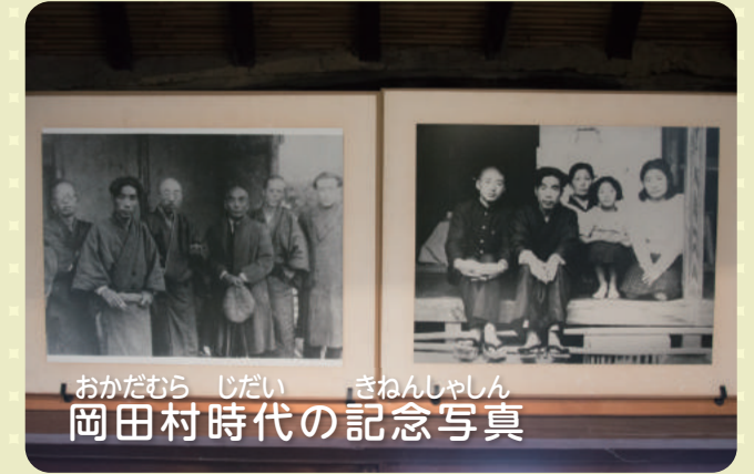
おかだむら じだい きねんしゃしん 岡田村時代の記念写真