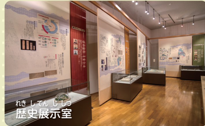
れきしてんじしつ 歴史展示室

みなさんの地域にもきっと、長い歴史と深い文化があるはずです。当館の展示を見学することが、みなさんにとって、近くにある歴史と文化を振り返るきっかけになればと思います。