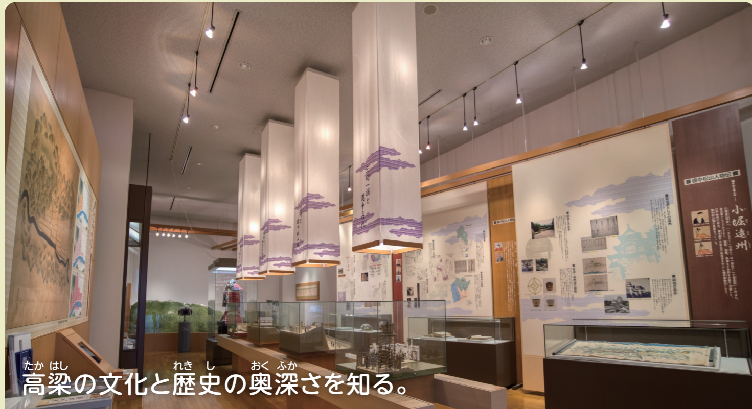
たかはし し れき し おく ふか 高梁の文化と歴史の奥深さを知る。

高梁市歴史美術館は高梁市の文化と歴史を広く知ってもらうために平成9年開館しました。