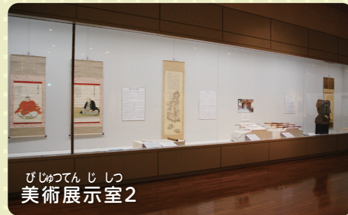
びじゅつてんじしつ 美術展示室2