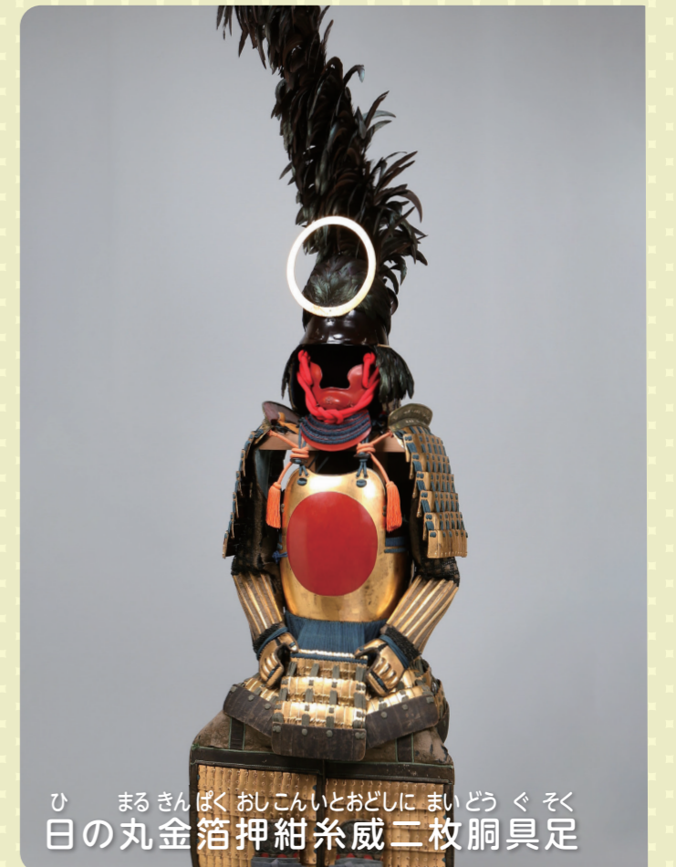
ひまるきんぼくおしこんいとおどしにまいどうくそく 日の丸金箔押紺糸威二枚胴具足