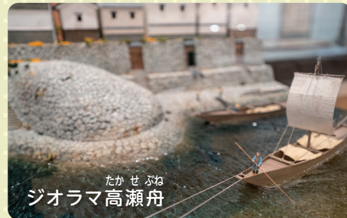
たかせぶね ジオラマ高瀬舟