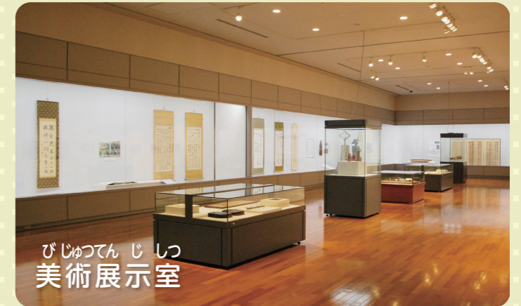
びじゅつてんじしつ 美術展示室